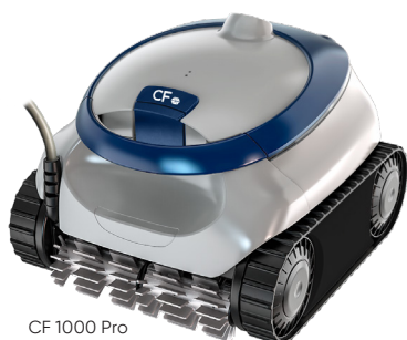
CF 1000 Pro