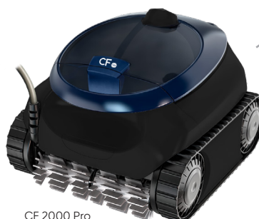
CF 2000 Pro